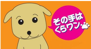
ひらかた観光大使「くらわんこ」 ©枚方文化観光協会