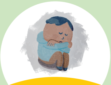
精神的な問題の発生