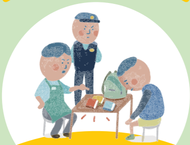
反社会的な行動の増加