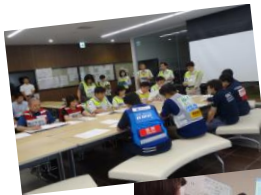
北河内医療圏 ↑ 医療救護本部会議

7月27日(木)に、平成29年度第1回健康医療都市ひらかたコンソーシアム代表者会議を開催しました。会議では、平成28年度の事業及び決算報告のほか、今後の連携事業や設立5周年記念事業について審議が行われました。