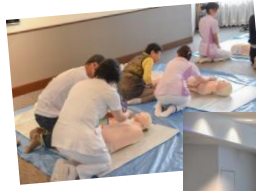
↑体験コーナーの様子

今回の公開講座は、身の回りで突然人が倒れた際の対応方法等について知識と理解を深める機会となり、台風による荒天の中でしたが、42人が参加し、満足度の高い講座となりました。