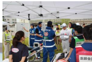
↑拠点応急救護所での 連携訓練