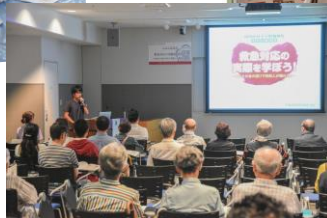
↑市民公開講座の様子