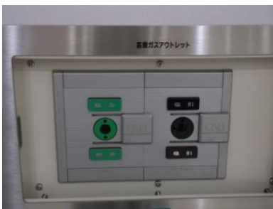
2階講堂などの壁に医療ガス設備を設置しています。

また、枚方市災害医療対策会議構成団体に参画し、地域防災計画に基づく災害医療訓練を実施し、災害発生時に迅速かつ適切な医療活動を展開できるように取り組んでいきます。