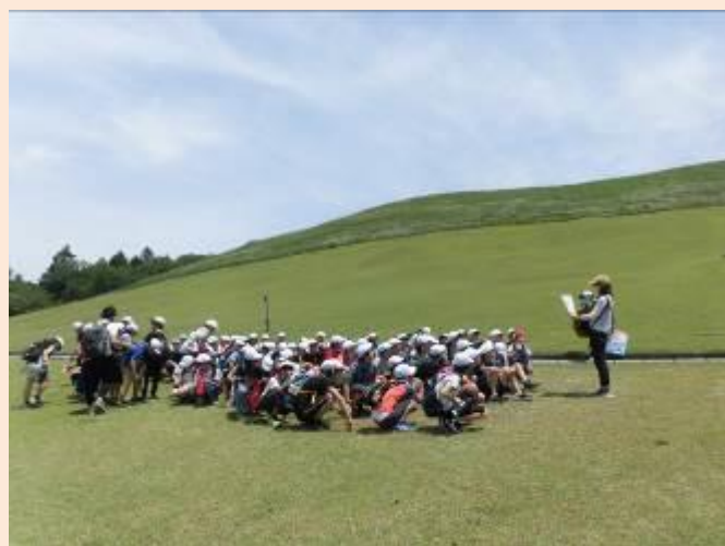
若草山に来ました