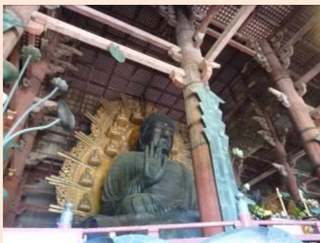
東大寺の大仏です。