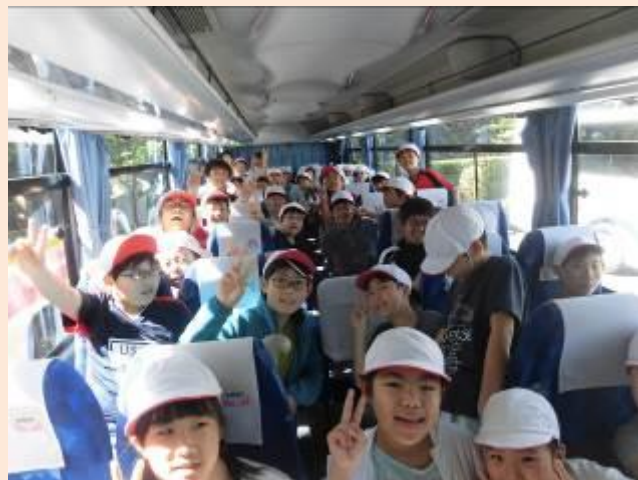
バスでの様子です