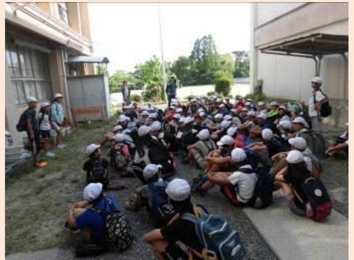
歴史について学ぶことができました