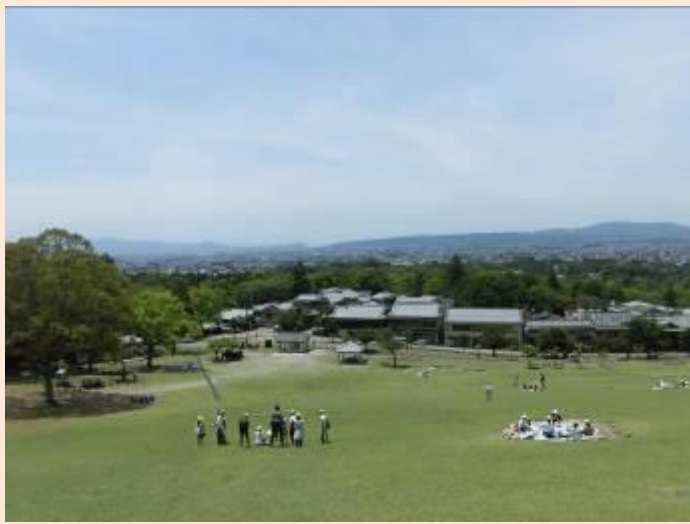
若草山からの眺めです