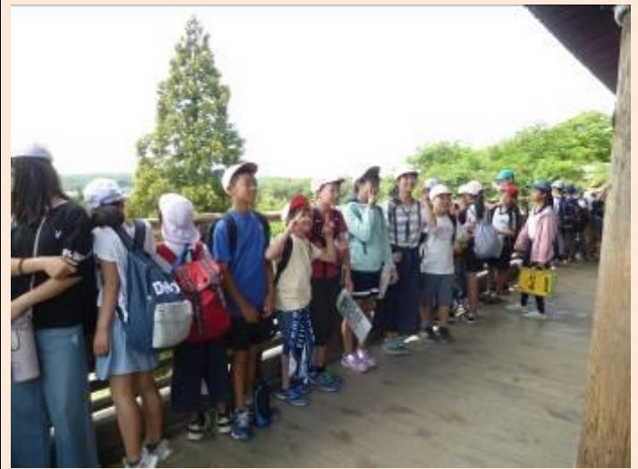
二月堂にも来ました