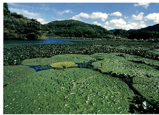
平の沢公園の「オニバス」