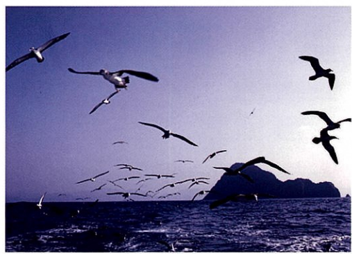
オオミズナギドリの生息する冠島

京都府環境影響評価条例に基づく手続きが適正かつ円滑に実施されるよう、 事業者や住民のみなさんの御理解と御協力をお願いいたします。