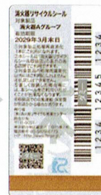
新品用シール (見本)

製品にはリサイクルシールが貼られています。消火器の使用期限が過ぎたら、取り扱い窓口へ引き渡してください。