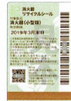
既販品用シール (見本)