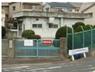
長尾家具町汚水中継ポンプ場(長尾家具町4丁目)