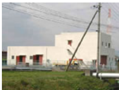
出口汚水中継ポンプ場(出口6丁目)