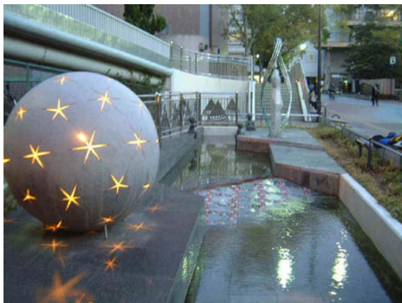
牽牛星と織女星をモチーフにした「ふれあい通り」のモニュメント