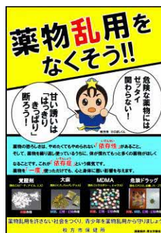
⑩クリアホルダー(青、緑、黄)